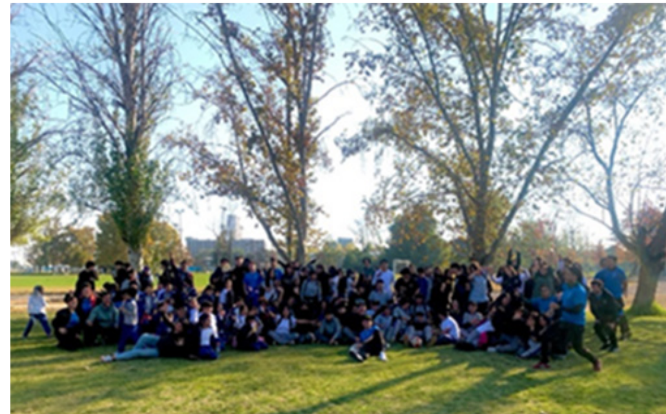
Actividad final con Socio Comunitario